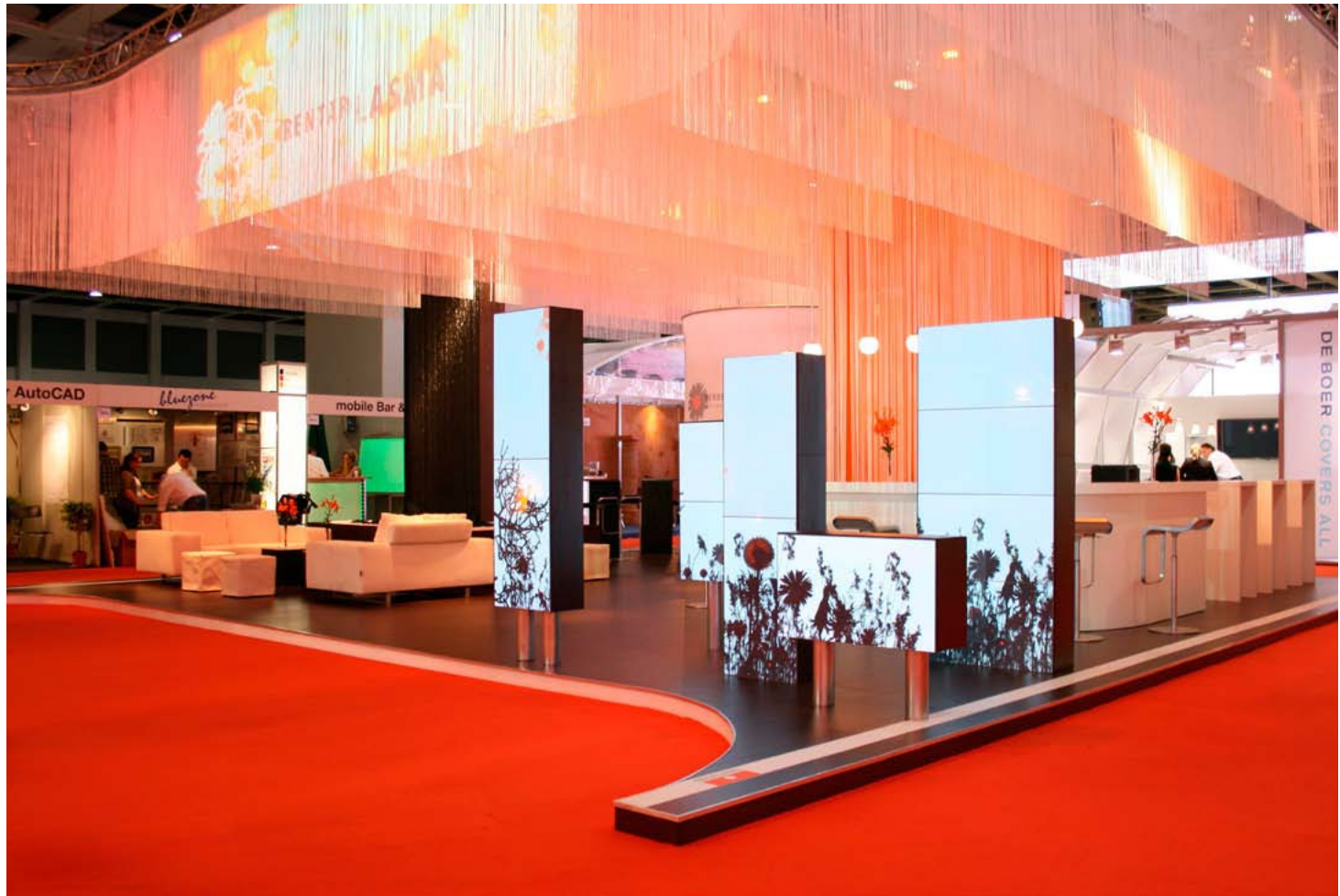
Kunde Werbe-Studio Hohmann | Messe Showtech, Berlin | Größe 117 qm