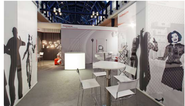
Kunde Thomson | Messe IFA, Berlin | Größe 160 qm