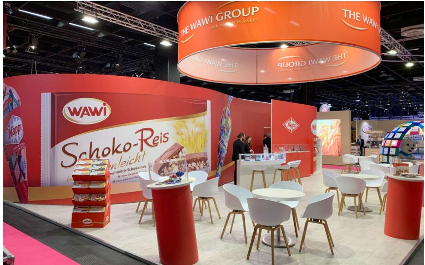
Kunde Wawi | Messe Süßwarenmesse, Köln | Größe 126 qm