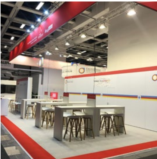
Kunde SHK | Messe Bautec, Berlin | Größe 324 + 196 qm