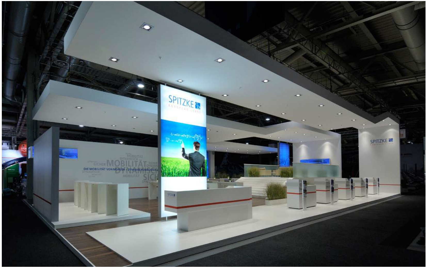
Kunde Spitzke | Messe Innotrans, Berlin | Größe 308 qm