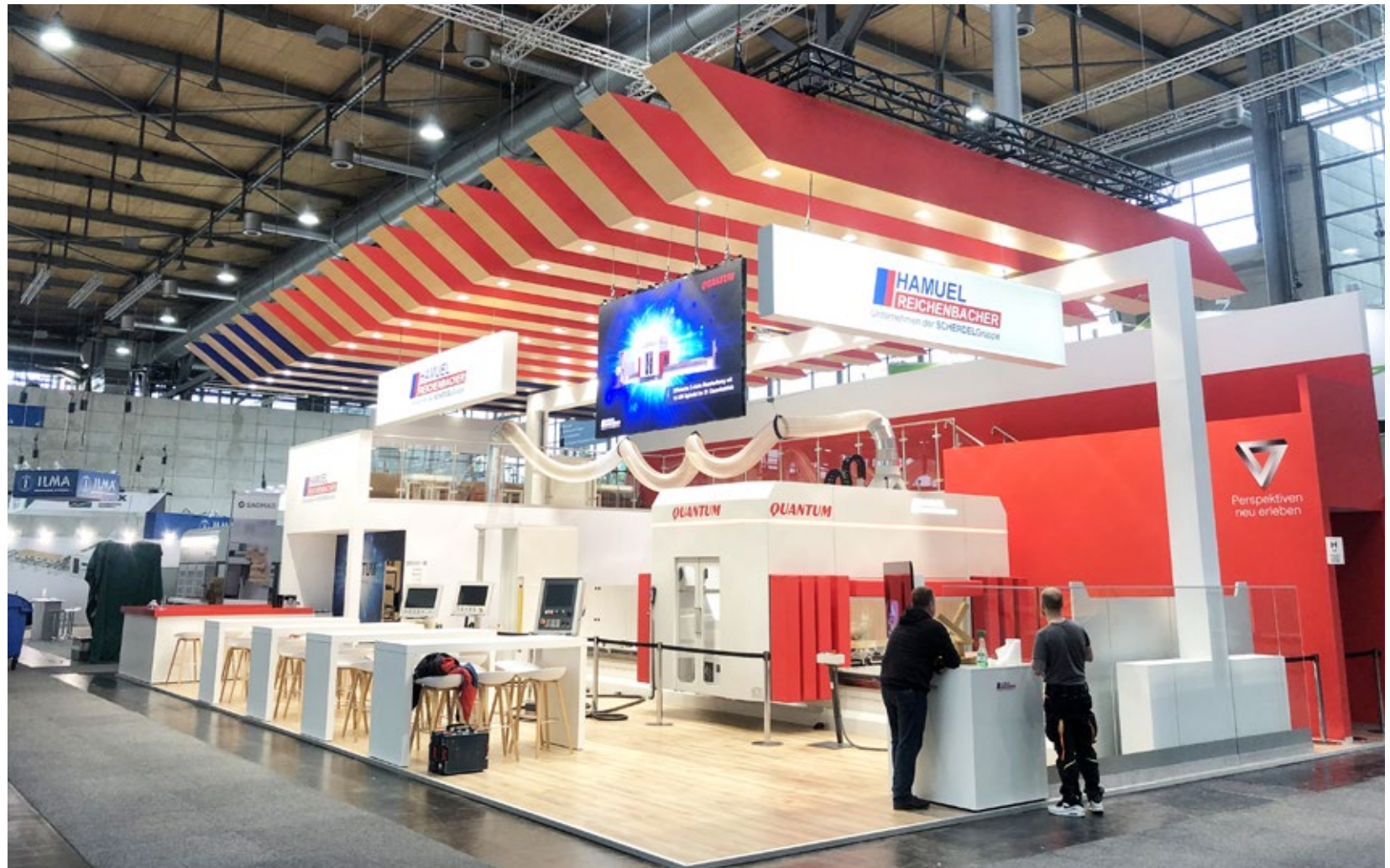
Kunde Reichenbacher Hamuel | Messe Ligna, Hannover | Größe 198 qm