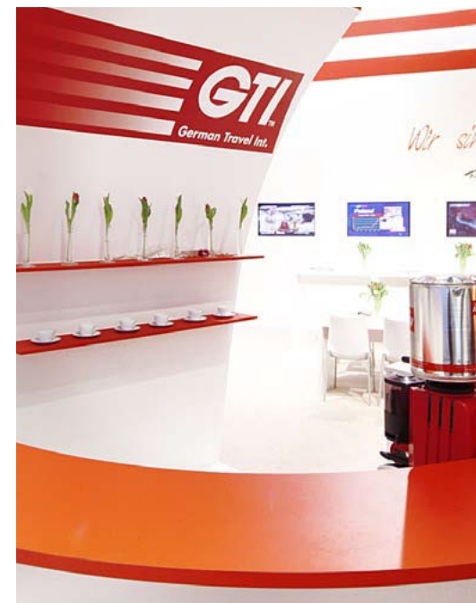
Kunde GTI Travel GmbH | Messe ITB, Berlin | Größe 240 qm