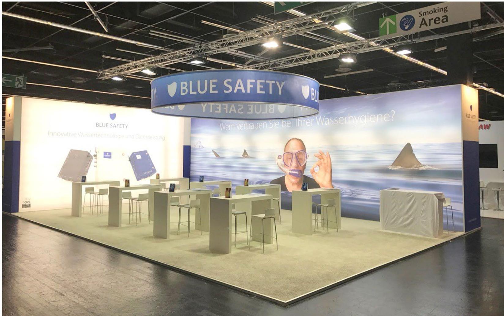
Kunde Blue Safety | Messe IDS, Köln | Größe 160 qm