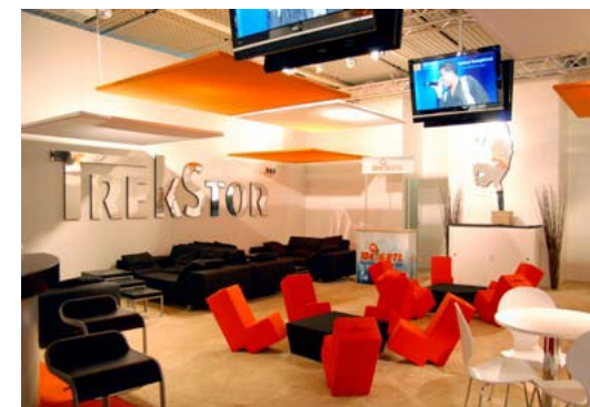
Kunde Trekstor | Messe IFA, Berlin | Größe 555 + 1650 qm