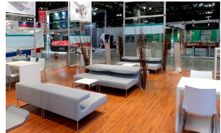
Kunde LMT | Messe Bi-Mu, Mailand | Größe 120 qm