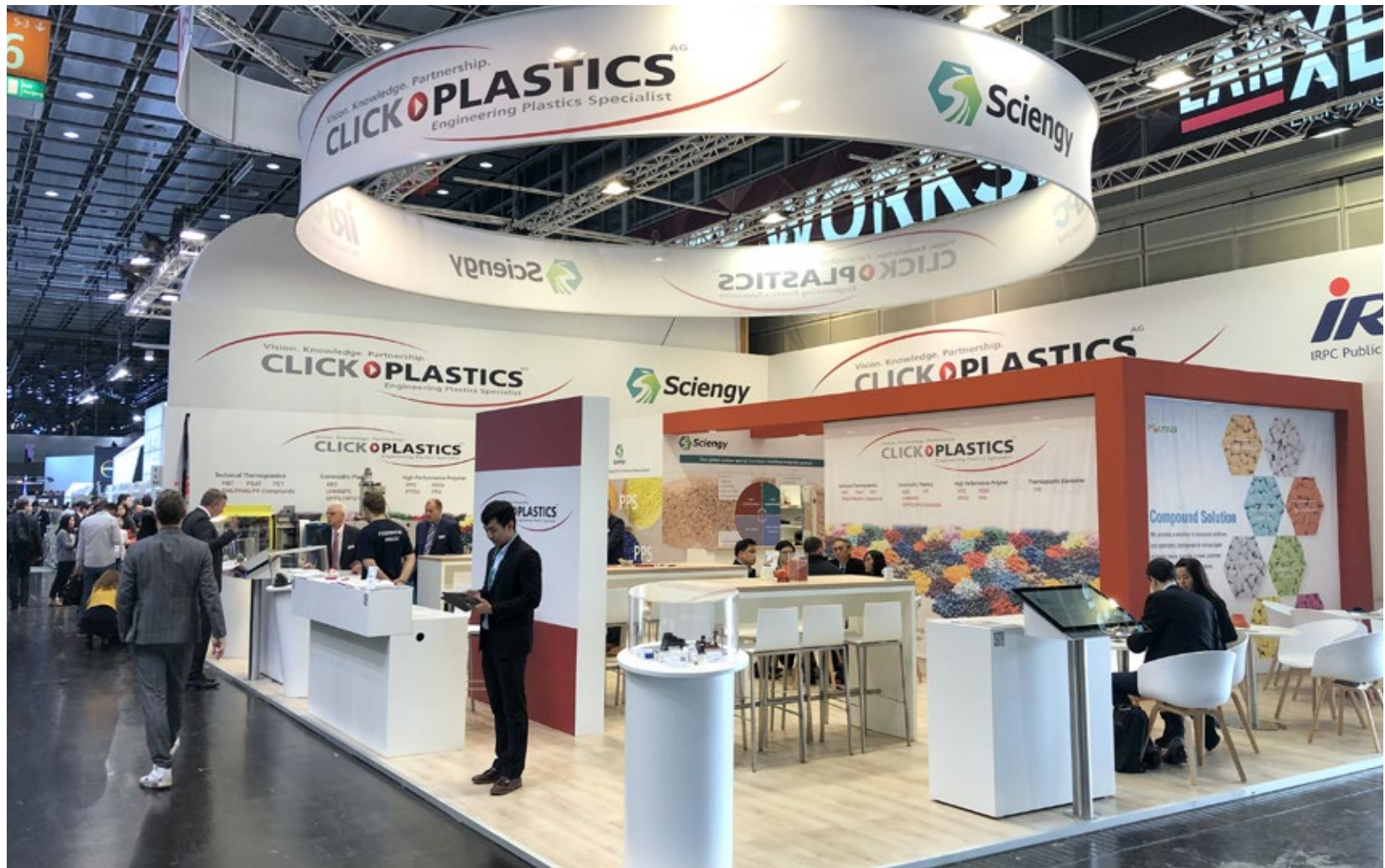
Kunde Click Plastics | Messe K, Düsseldorf | Größe 136,5 qm