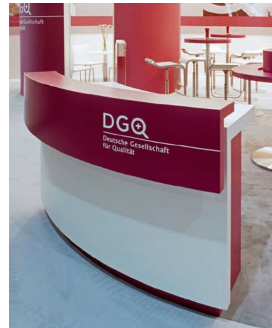
Kunde Deutsche Gesellschaft für Qualität | Messe Control, Stuttgart | Größe 54 qm