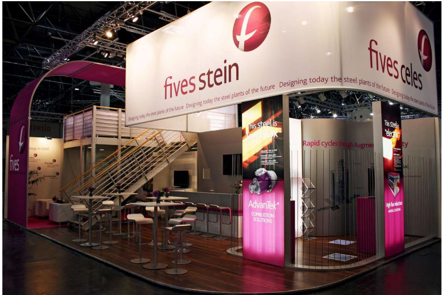
Kunde Fives Group | Messe Thermprocess, Düsseldorf | Größe 84 qm