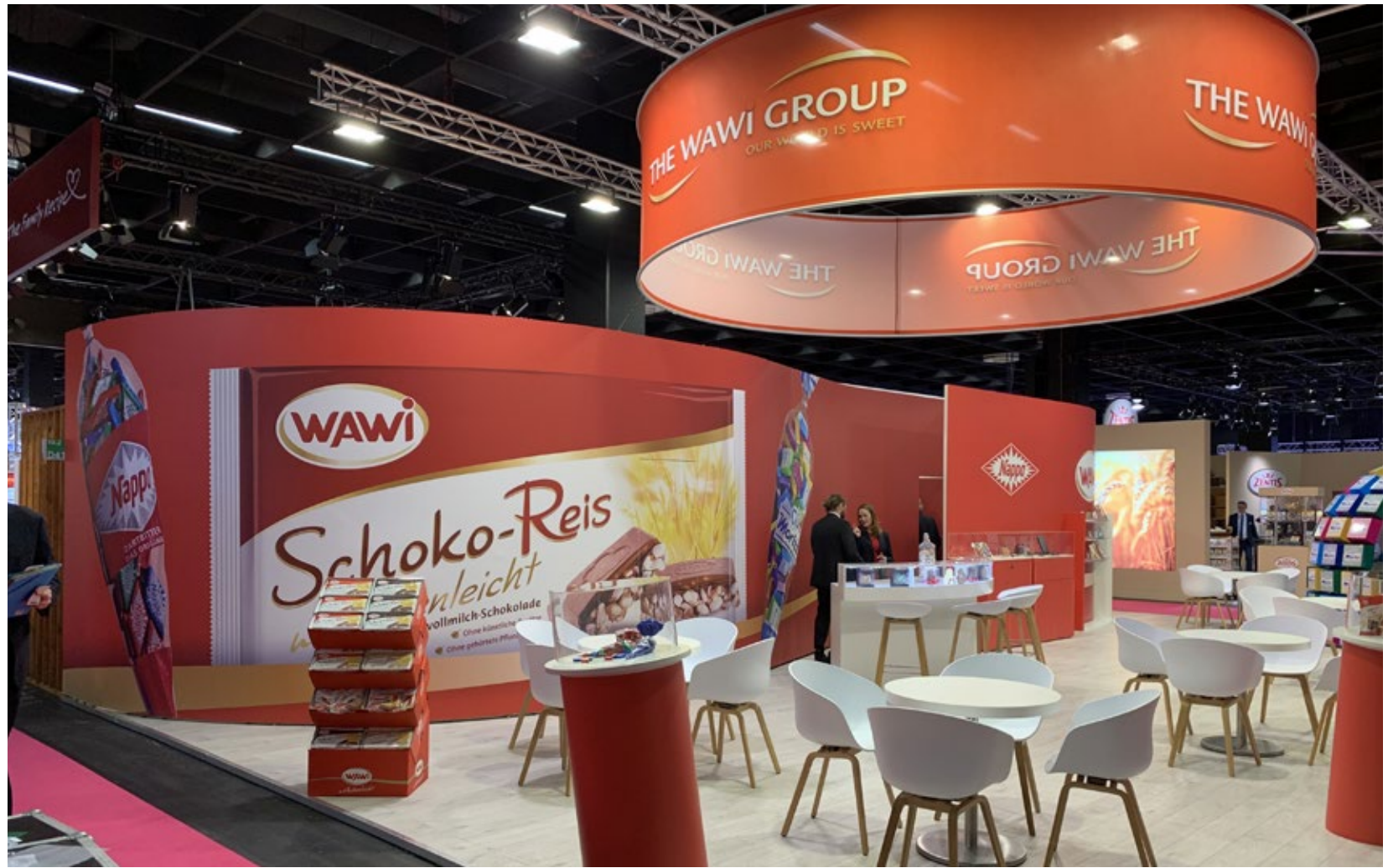
Kunde Wawi | Messe Süßwarenmesse, Köln | Größe 126 qm