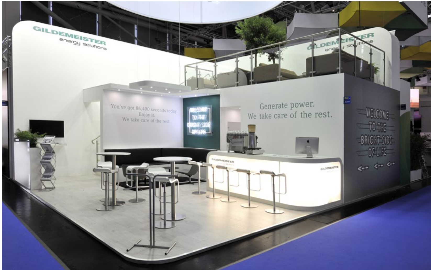
Kunde Gildemeister | Messe Intersolar, München | Größe 72 qm