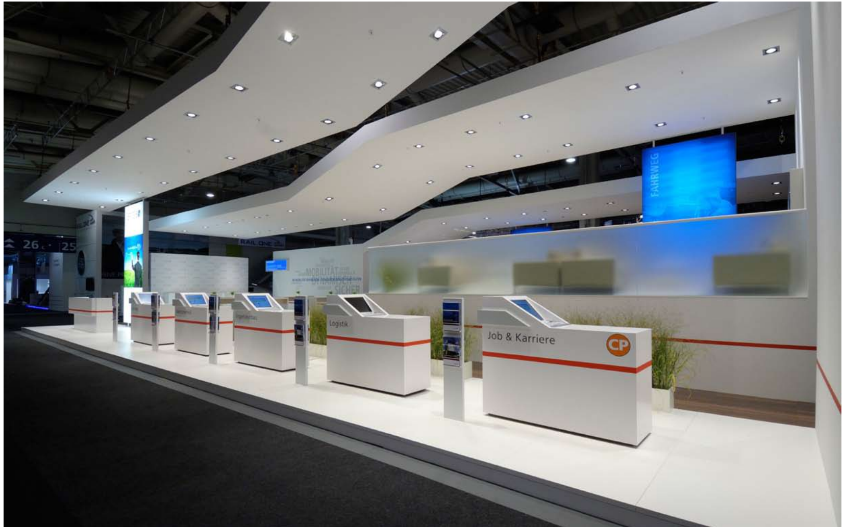
Kunde Spitzke | Messe Innotrans, Berlin | Größe 308 qm