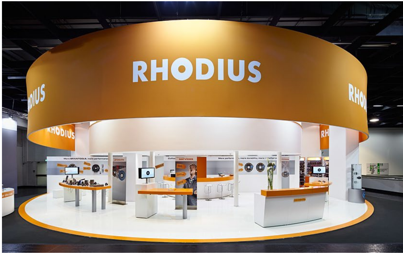
Kunde Rhodius | Messe Eisenwarenmesse, Köln | Größe 180 qm