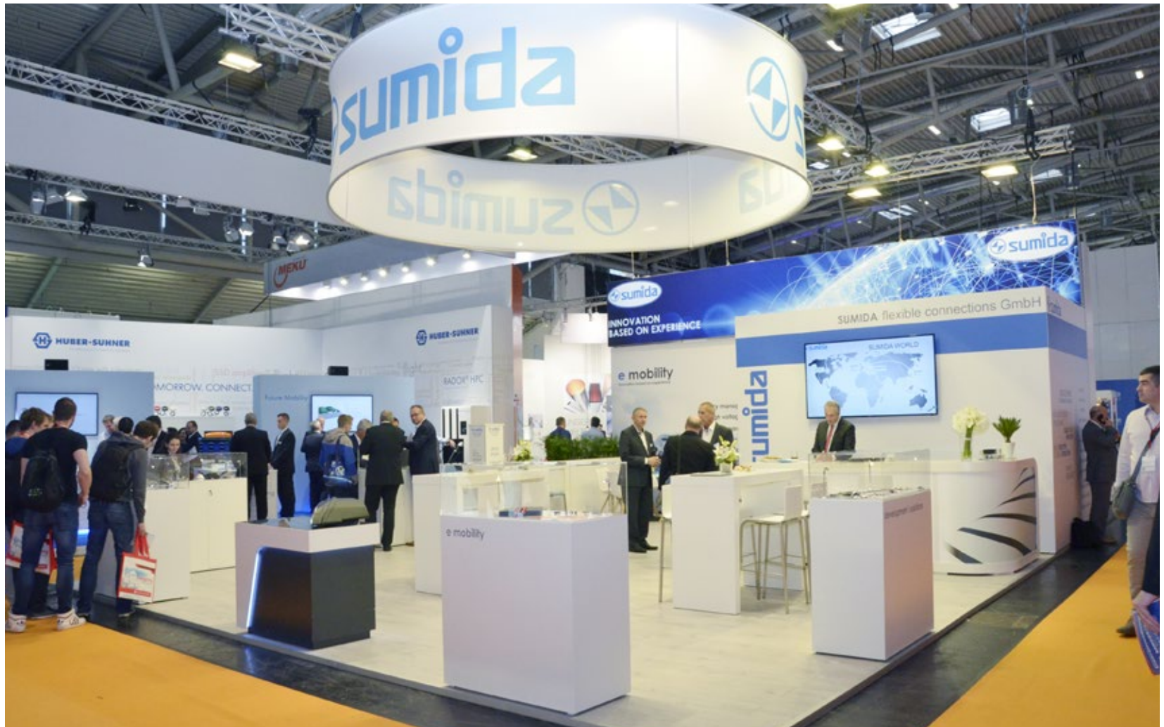
Kunde Sumida | Messe Electronica, München | Größe 80 qm