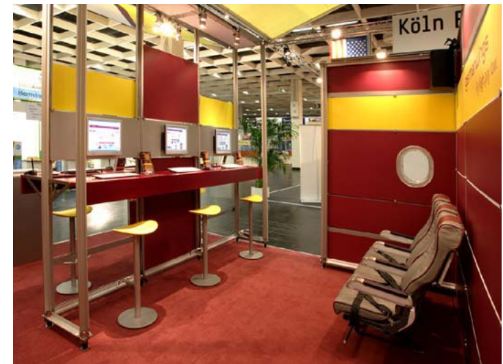
Kunde Germanwings GmbH | Messe ITB, Berlin | Größe 60 qm