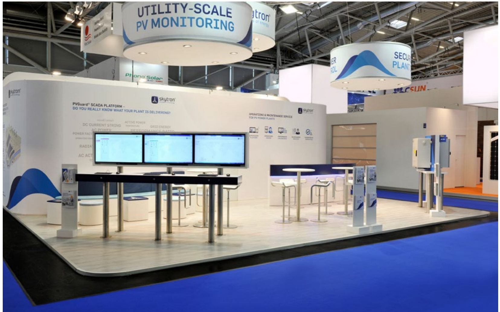
Kunde Skytron | Messe Intersolar, München | Größe 70 qm