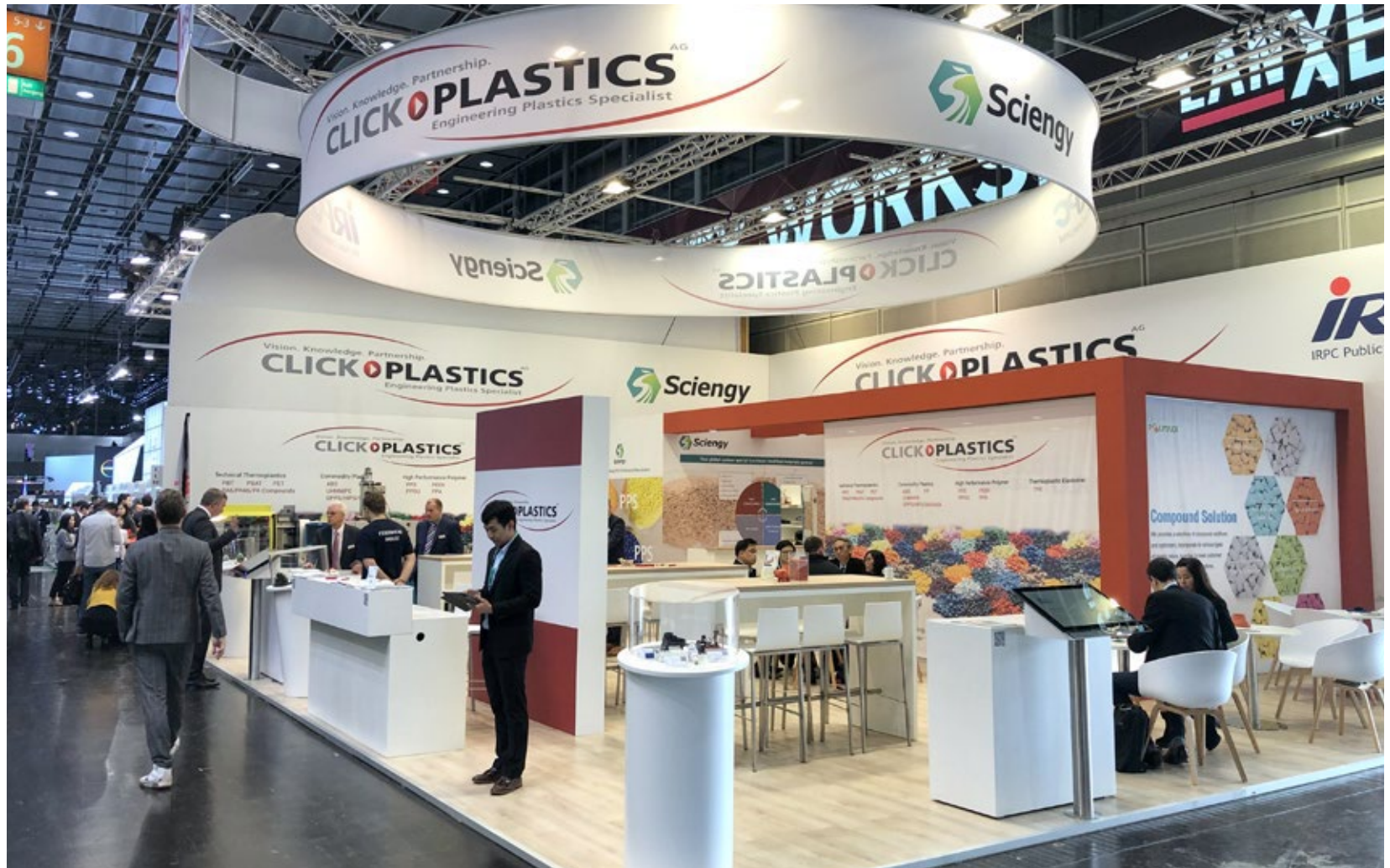
Kunde Click Plastics | Messe K, Düsseldorf | Größe 136,5 qm