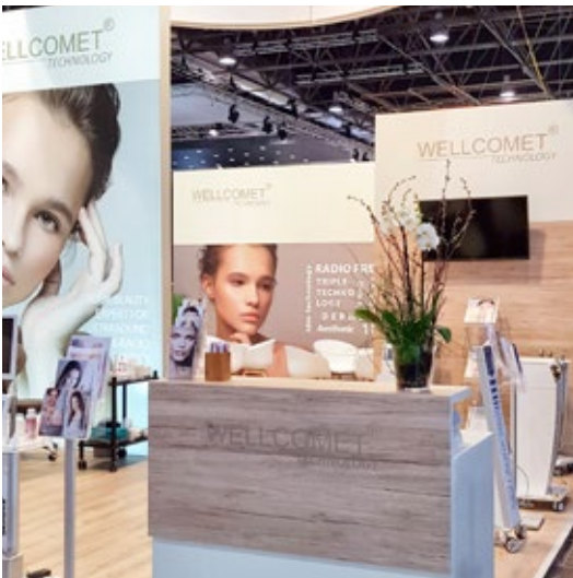
Kunde Wellcomet | Messe Beauty, Düsseldorf | Größe 48 qm