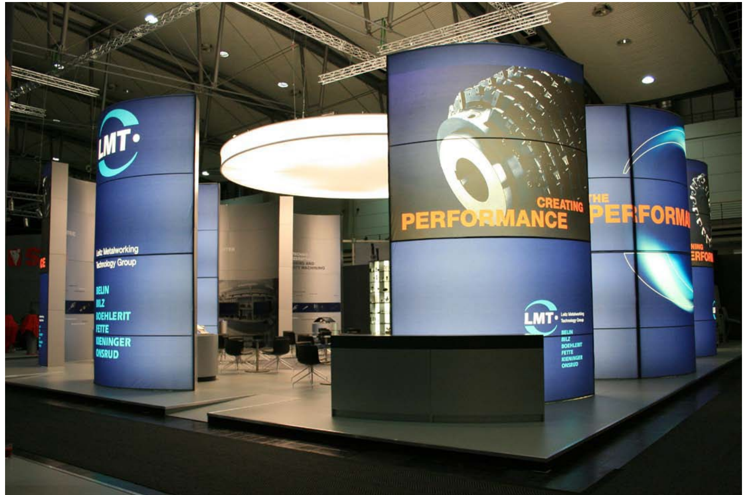
Kunde LMT | Messe EMO, Hannover | Größe 432 qm