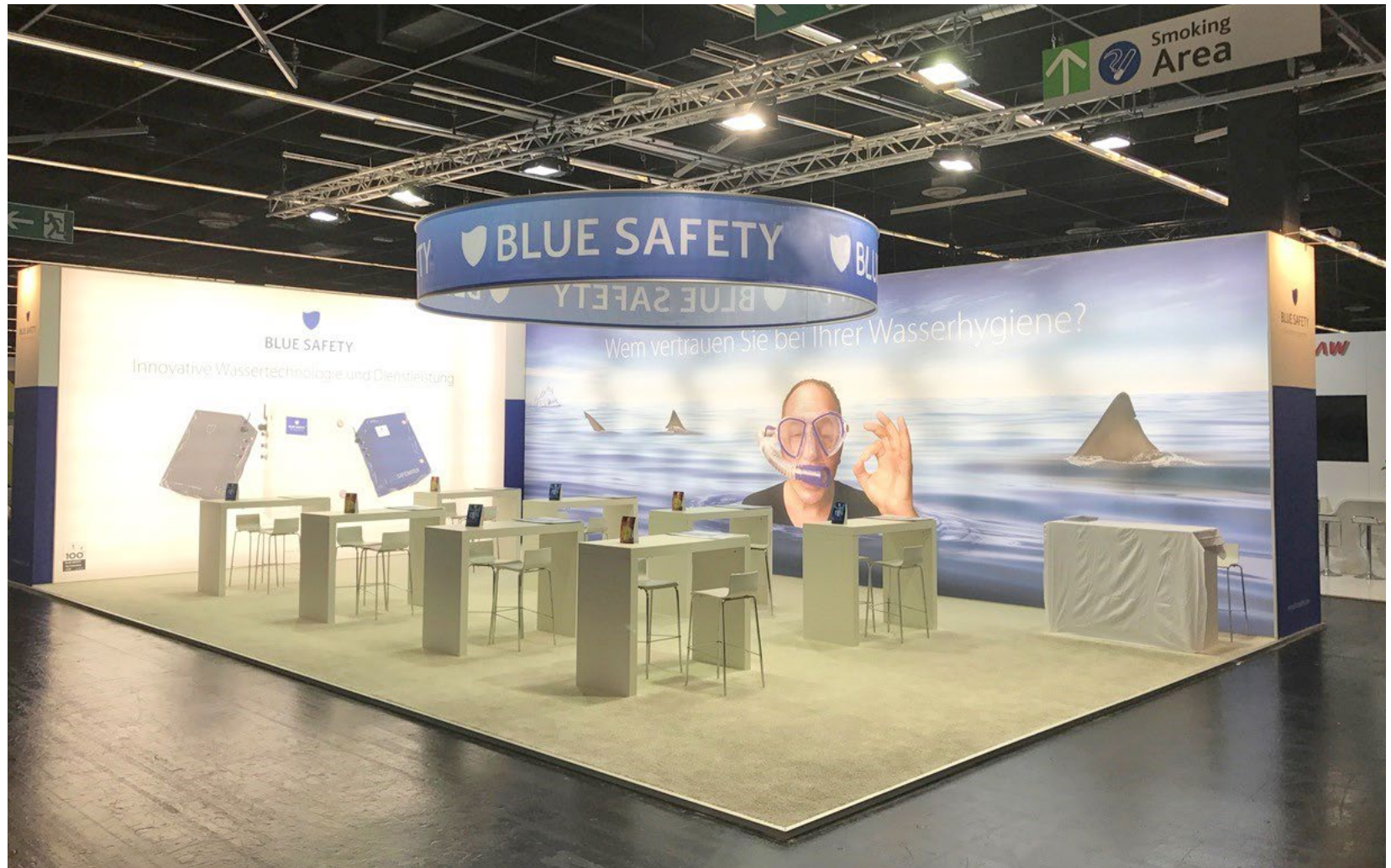
Kunde Blue Safety | Messe IDS, Köln | Größe 160 qm